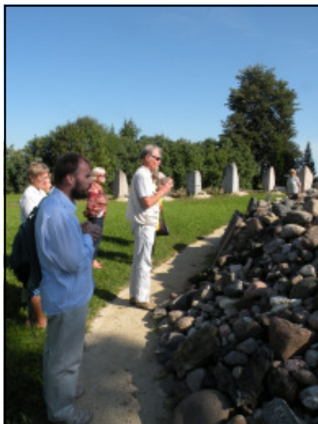
Mälestushetk Pilistvere kivikangrul