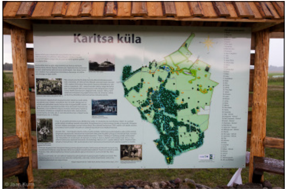
Vastavatud Karitsa küla infotahvel