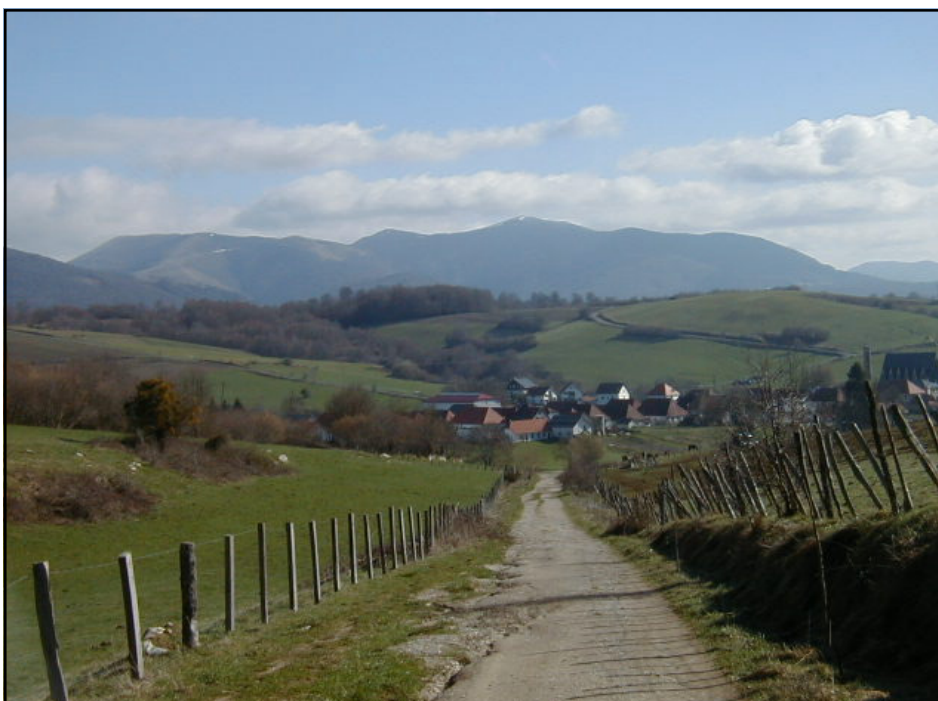
Tee, lõputu tee...

asjaoludest, mis on seotud majutuse ja magamisega. Esiteks tubades on mehed ja naised segamini, just nii, kuidas sa ööbimiskohale jõuad, sedasi sind magama paigutatakse. Teine olukord puudutab norskamist. Kui ruumis magab juba kaks inimest koos, siis tõenäosusprotsent, et keegi ei norska, on olematu, liiatigi veel siis, kui ühes ruumis magab 100 inimest. Lisaks veel inimesed, kes juba kell viis hommikul kotte hakkasid pakkima, et teele minna. Ütlen ka seda, et sellel, kes niisuguseks katsumuseks valmis pole, on väga raske. Lõppude lõpuks võid ju magada ka hotellis, kui raha on.