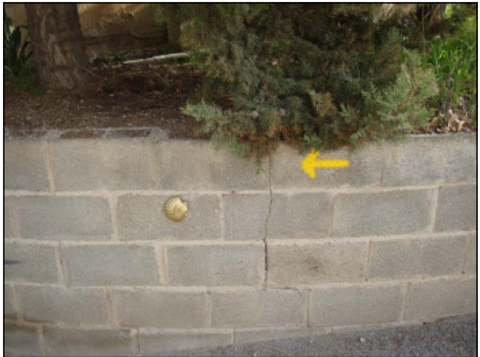
Kollane nool ja merikarp näitavad õiget suunda

Kui tahta käia algusest lõpuni seda teekonda, siis pidavat kuluma umbes kuus nädalat. Sisse on arvestatud aeg ringivaatamiseks. Meie käisime 11 päeva ja läbisime umbes 30 kilomeetrit päevas.