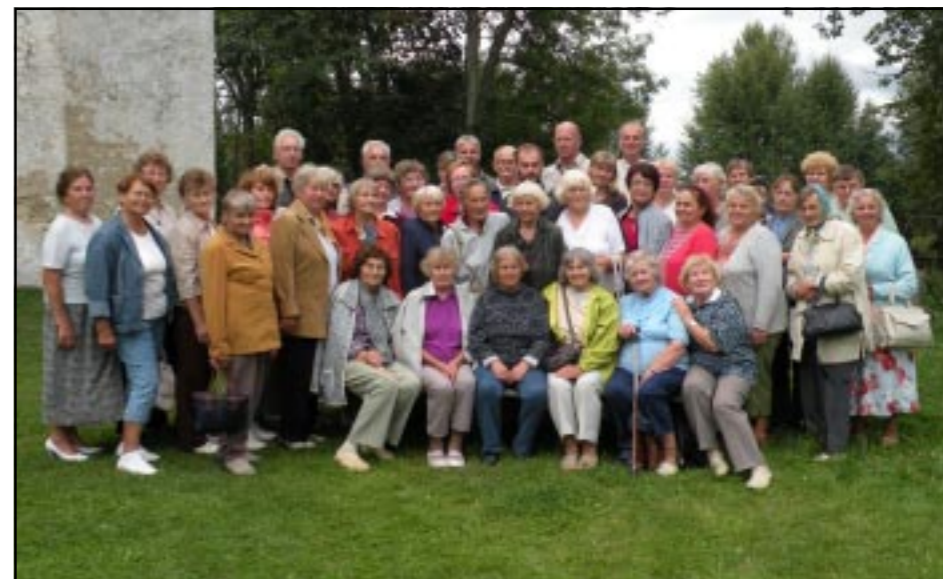
Juuru teelised Järva-Madise kirikuaias