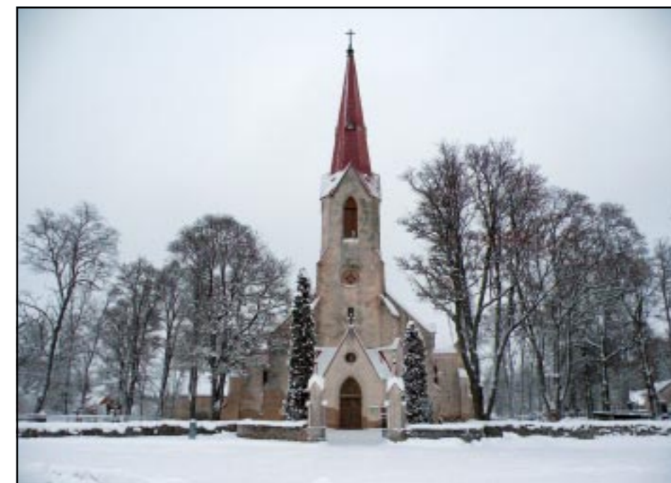
Talvine Juuru kirik

Advent mingis mõttes piirab meid; juhib tähelepanu sellele, et oldaks vaiksemalt, oldaks sissepoole pööratud,