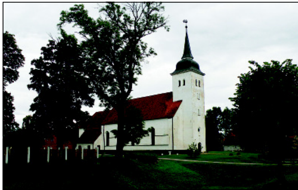
Viljandi Jaani kirik